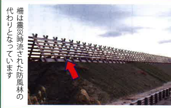
柵は震災時流された防風林の代わりとなっています