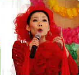
↑曲に合わせて、ドレスや着物に早着替え。あつという間の熱いステージに、会場も大興奮でした