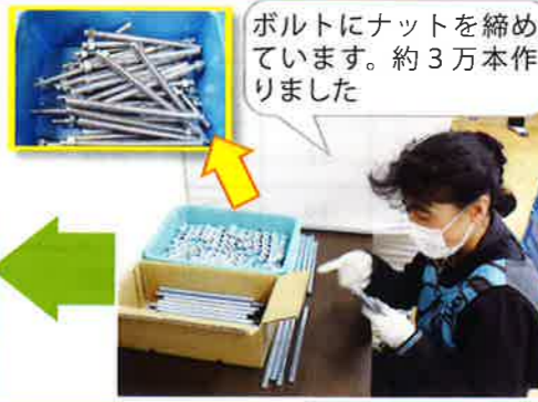
ボルトにナットを締めつけています。約3万本作りました

第一作業グループの利用者さんが中心で組立をしていて、「寸切(すんぎり)ボルト」は、仙台の海岸沿いにある防風柵の固定に使われています。