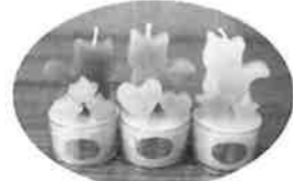
ロウソク(生活介護)