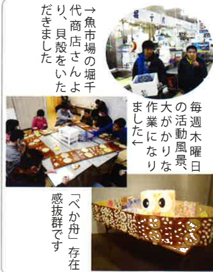
→魚市場の堀千代商店さんより、貝殻をいただきました

第17回市民手工芸作品展への出品に向け、アートクラブ(24名)では浦安ならではのものを作ろうと「べか舟」の制作にチャレンジしました。あさりの貝殻を装飾に活用し、折り紙をちぎる人、段ボールに貼る人、色を塗る人など、利用者個々の活動を進めること3か月、全長が約15メートルにもなる作品に仕上がりました。「折り紙や貝を貼るのが大変」という声が聞こえてくる中での制作でしたが、展示会場では、その存在感に大満足。見学後の一人ひとりの表情から、次回へのモチベーションの高まりを感じました。