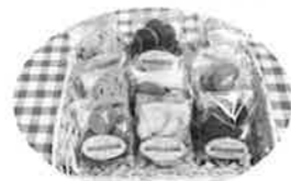
お菓子工房(就労継続支援B型)