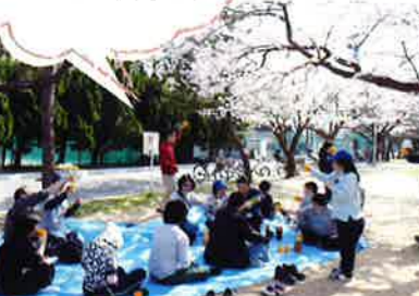
桜の下でお団子片手に乾杯 (あさやけ班)