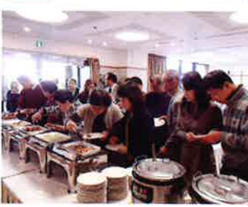
↑カニとカレーが人気で、ケーキ、タルト、ムースなど女性に嬉しいスイーツも豊富でした